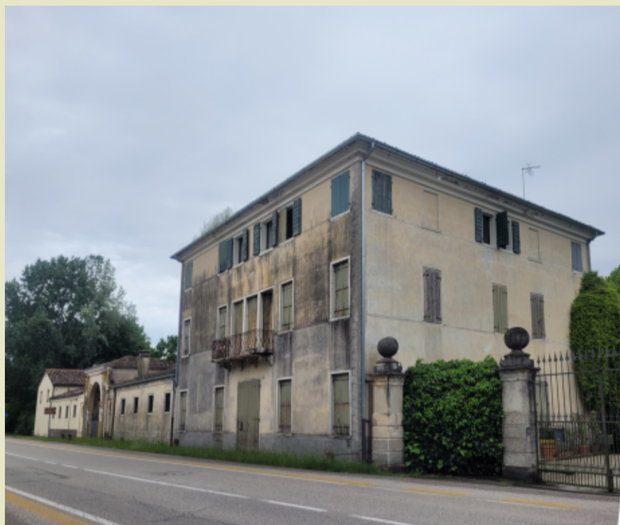
Barchessa di Villa Heinzelmann Donà Dalle Rose